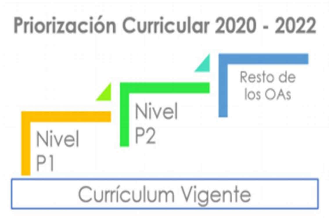
Ilustración N°1 Representación de Niveles de Priorización por grado, MINEDUC, Priorización Curricular, 2020.

Nivel de priorización 1 (Nivel P1): Se propone a las escuelas avanzar en un primer nivel con una selección de objetivos imprescindibles; es decir, aquellos considerados esenciales para avanzar a nuevos aprendizajes. Estos objetivos actuarán como un primer nivel mínimo que permitirá a las escuelas organizarse y tomar decisiones de acuerdo con las necesidades y las reales posibilidades en el actual contexto.