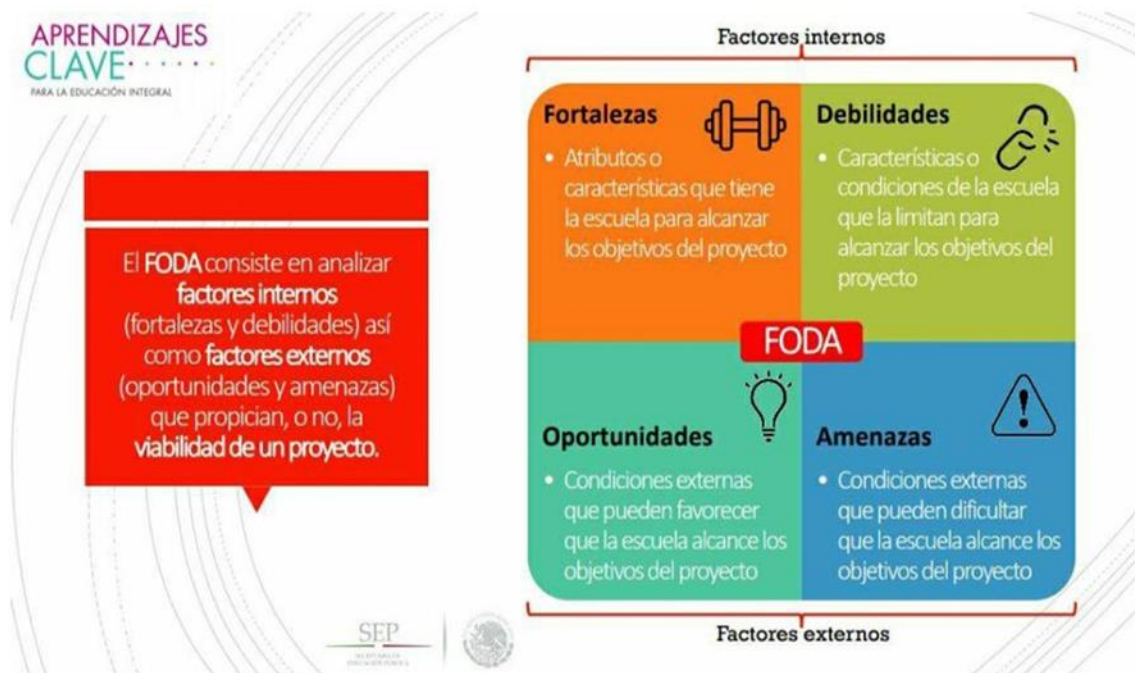
Ilustración N°5 Análisis FODA, Aprendizajes claves para una educación integral, SEP.