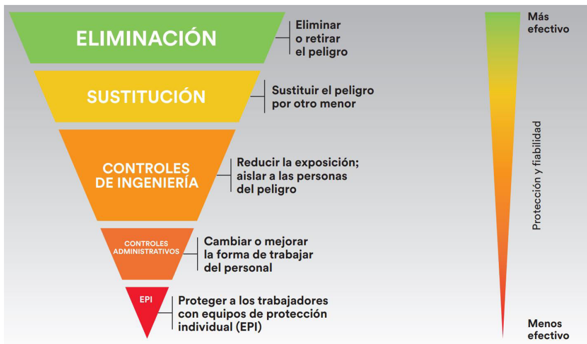
IMAGEN 3 : JERARQUIA DE CONTROLES

La siguiente pirámide invertida muestra la jerarquía que es posible instituir para los controles: