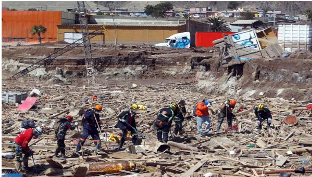
Figura N° 13 “Fotografía Chile posee deficiente red de monitoreo para emergencias climáticas según expertos”

conjunto de las entrevistas se destaca la gran necesidad de un enfoque integral que aborde desde la recuperación física como el bienestar psicosocial, el interés de intervenciones sostenibles y apoyo continuo para la adaptación hacia las comunidades luego de catástrofes logrando promover la resiliencia individual como colectiva.