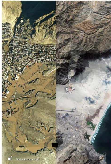
Figura N a 3:

aluvión provocó los mismos estragos que el aluvión del año 2015, arrasando con todo a su paso y destruyendo gran parte de la comuna de Chañaral.