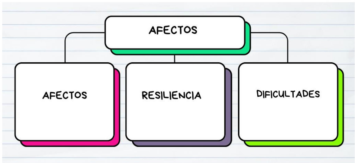
Mapa N° 2 Objetivo específico 2: Elaboración propia.

Con respecto al objetivo específico II, está asociado a la categoría por nombre Afectos y Resistencias junto con las subcategorías denominadas Afectos, Resiliencia y Dificultades.