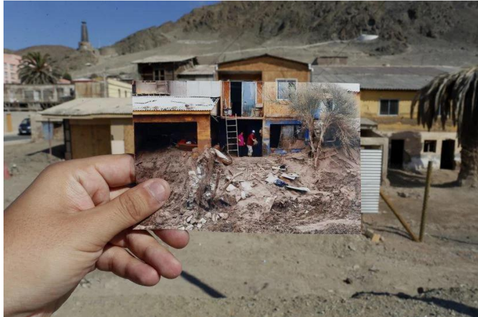
Figura N°8 “Fotografía del antes y después del aluvión sector costanera”