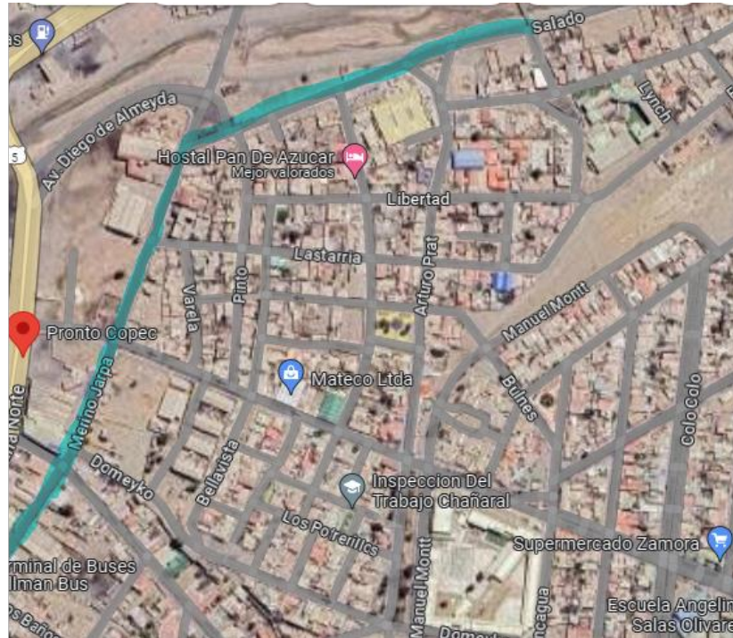
Figura N° 4 Fuente: Mapa de Google Maps, año 2024.

que directamente será fundamental para poder tener una visión de una mejor calidad acerca del contexto de la catástrofe estudiada.