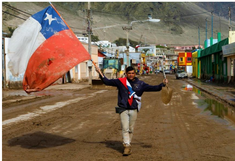
Figura N° 14 “Fotografía Chañaral, ícono del desastre por las inundaciones del norte”

Por otro lado, como transformación negativa para la comuna se visualiza el gran impacto que tuvo de manera emocional, mental y a la salud, ya que producto del aluvión generó un deterioro ambiental, más del que ya había anteriormente por causas de los relaves mineros, el aluvión en conjunto con la contaminación de las mineras en consecuencias ese día afectó nuevamente por el motivo de la tierra y residuos que por años se ha encontrado contaminadas, lo cual influyó gravemente a que el aluvión fuera de flujo turbulento y tuviera una magnitud de daño como fue el del año 2015, en el cual diversos estudios confirman la presencia de algunas enfermedades producto a esto, tales como asma, problemas respiratorios, cáncer etc., debido a las partículas que hay.