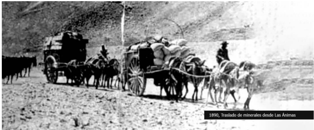
Figura N° 2: “1890, Traslado de minerales desde las Ánimas”.

En la medianoche del día 10 de noviembre del año 1922 la Comuna de Chañaral sufrió un acontecimiento de desastre socio natural, cuando un terremoto de 9 grados de magnitud en la escala de Mercalli y de magnitud 8.5 en la escala de Richter azotó la Comuna de Chañaral. El mar entró cinco veces en marejadas sucesivas que llegaron hasta un kilómetro tierra adentro, destruyéndolo todo y cobrando al menos 17 víctimas. La parte baja de la ciudad era la más importante desde el punto de vista comercial y quedó arrasada (Chañaral News, 2010).