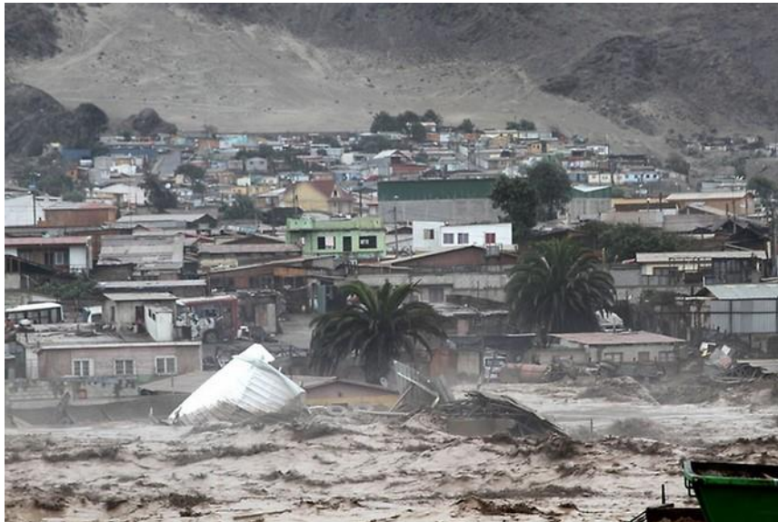
Figura N°7 “Fotografía del aluvión de Chañaral tomada desde la costanera”

El apoyo psicosocial es vital para dar respuestas ante situaciones de catástrofes, los entrevistados destacaron que la ayuda del gobierno en sí fue limitada, sin embargo, la ayuda social que les brindaron ciudades y localidades cercanas fue más numeroso, así como las amistades, juntas de vecinos, iglesias, etc., dejando una enorme gratitud a estos