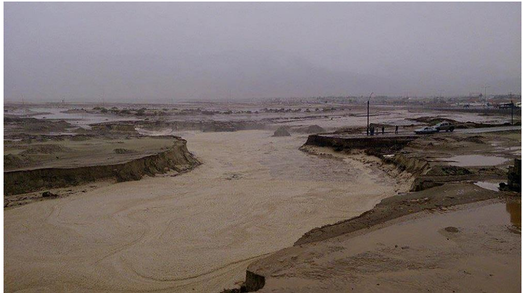
Figura N°9 “Fotografía del aluvión de Chañaral, socavón”

El sentido de resistencia de los habitantes se destaca en el amor de familia, la fuerza en distintos aspectos de la vida de ellos ya sea en lazos familiares, en el apoyo mutuo para enfrentar las diversas dificultades y seguir adelante con sus vidas de manera resiliente.