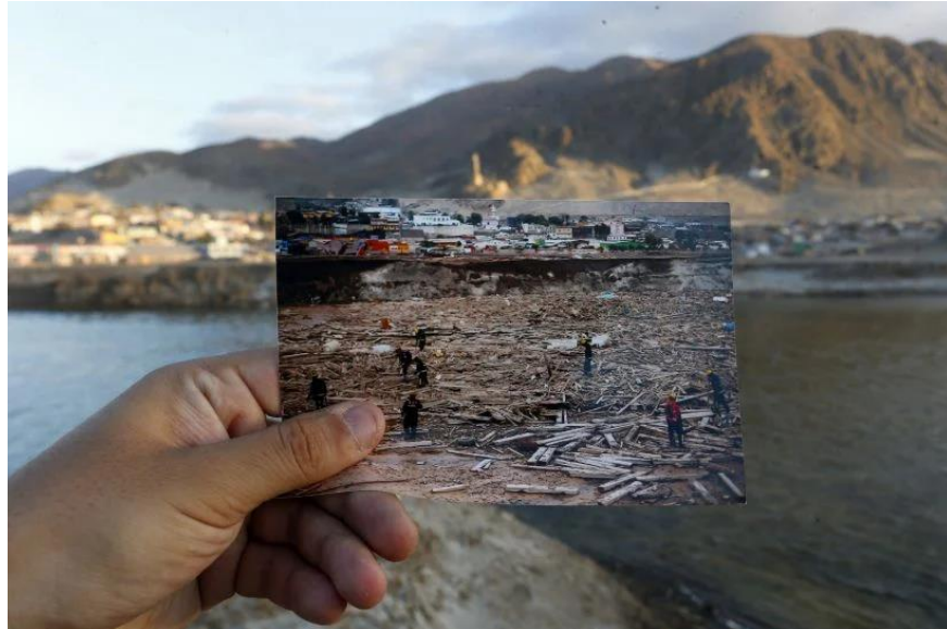
Figura N°11 “Fotografía El antes y después en fotos de Chañaral a casi un año del aluvión” Fuente: SoyChile, año 2016.