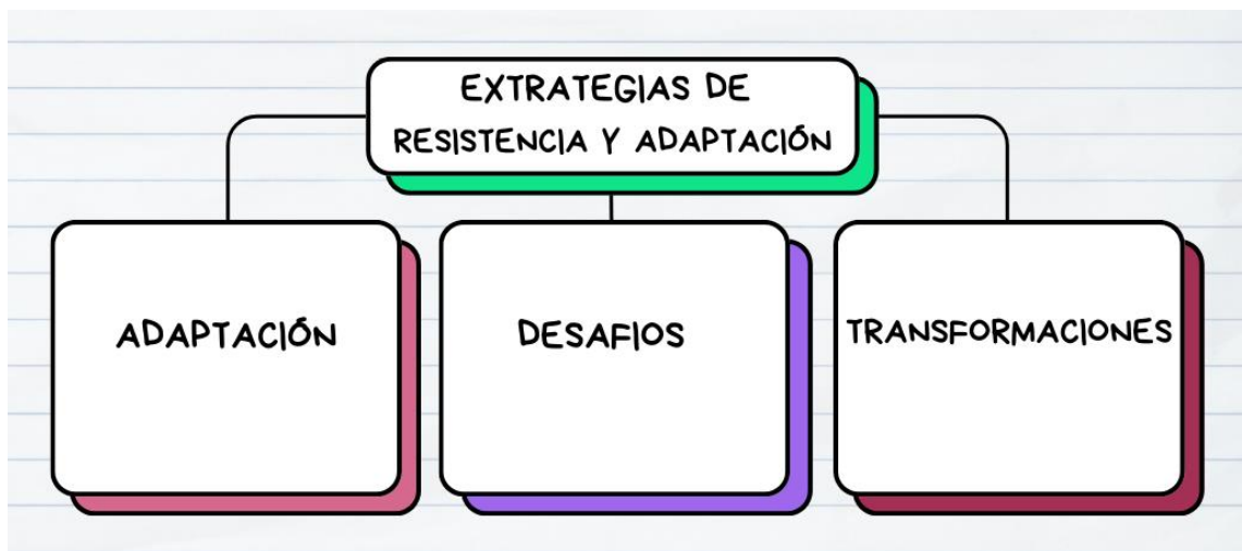
Mapa N° 3 Objetivo específico 3: Elaboración propia.

De acuerdo con el objetivo específico III, asociado a la categoría por nombre Estrategias de Resistencias y Adaptación conectando así con las subcategorías que son Adaptación, Desafíos y Transformaciones.