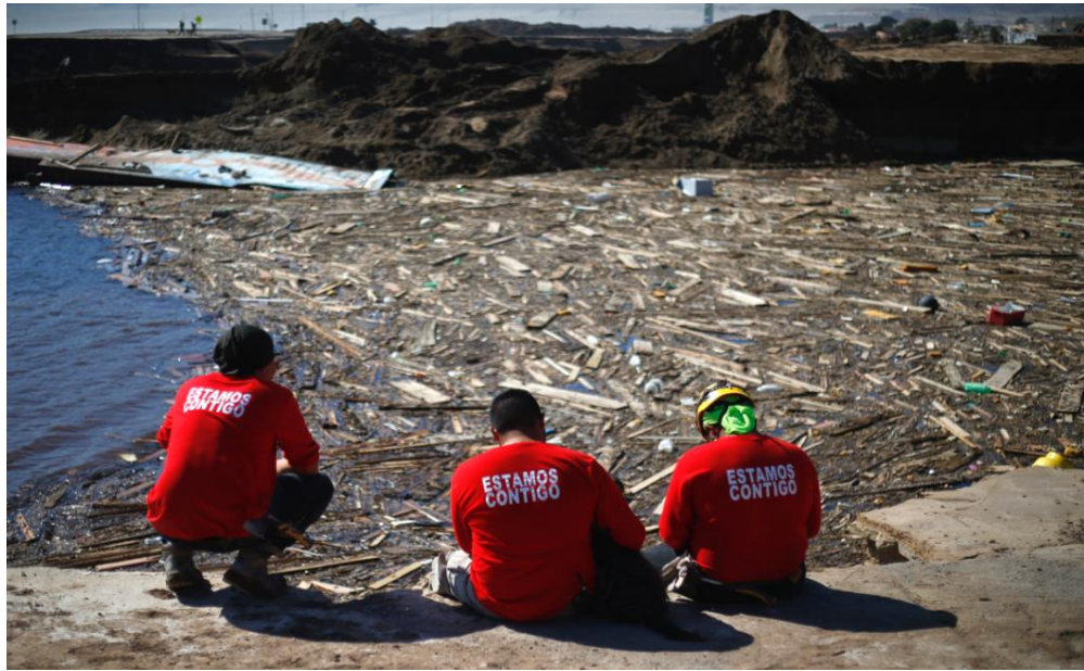
Figura N° 12 “Fotografía Chile posee deficiente red de monitoreo para emergencias climáticas según expertos”