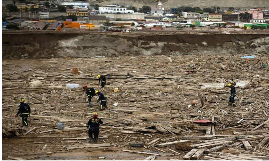
Figura N° 15 “Fotografía Fiscalía de Chañaral confirma hallazgo de dos cuerpos en socavón”