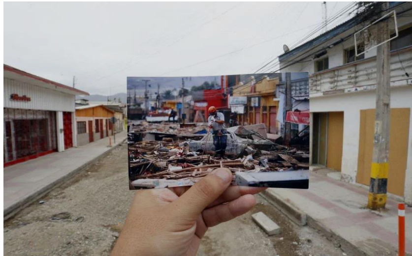
Figura N°6 “El antes y después del aluvión”