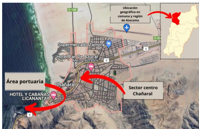
Figura 1: Ubicación de Chañaral. Ubicación del territorio urbano y área costera.

La comuna de Chañaral es una localidad la cual se encuentra ubicada en la región de Atacama, se localiza en el norte chico de Chile donde está ubicado a 167 km. al noroeste de la ciudad de Copiapó, la comuna cuenta con una superficie de 24.436,2 km. Chañaral junto con la comuna de Diego de Almagro conforman la provincia de Chañaral, siendo también capital de esta unidad territorial. (Ilustre Municipalidad de Chañaral, 2023). La provincia de Chañaral se encuentra situada al norte de la Región de Atacama, se extiende entre el litoral marino y la cordillera de los Andes, en el extremo sur del desierto de Atacama. Se encuentra a 167 km de Copiapó y a 969 km de Santiago (González, 2018, p. 1).