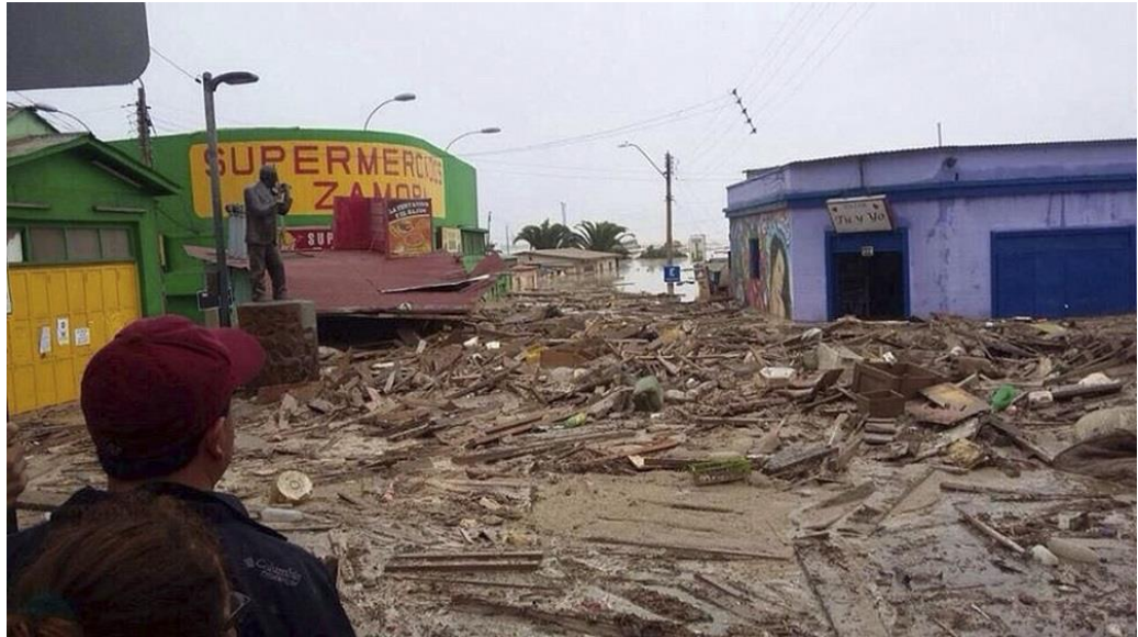
Figura N°5 “Fotografía del aluvión de Chañaral”