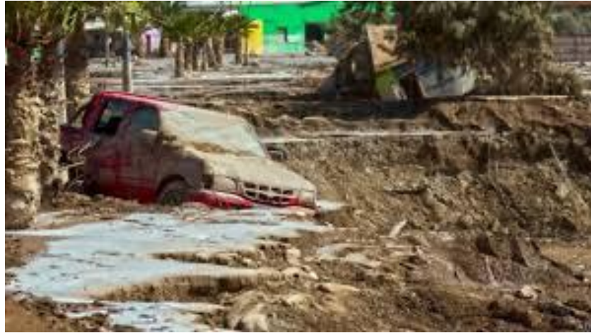
Figura N°10 “Fotografía del aluvión de Chañaral, sector costanera”

Ante lo anterior que destacan los entrevistados, mencionan cada dificultad que tuvieron en el proceso del aluvión y después en el proceso de reconstrucción.