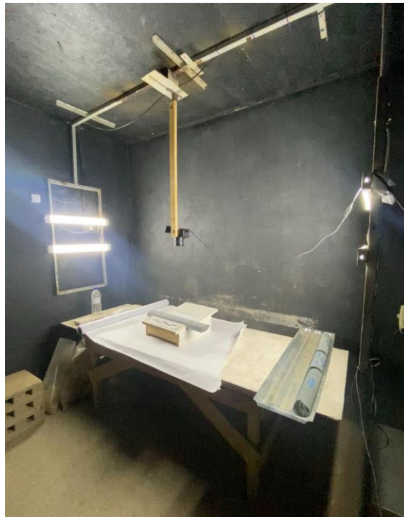
Figura 2. 5 Sala de fotografía

Los errores sistemáticos son los más peligrosos, ya que no se detectan fácilmente y afectan todas las muestras por igual, generando un sesgo continuo en los resultados. Esto puede llevar a sobrevalorar o subestimar leyes minerales, alterando la interpretación geológica global del yacimiento.