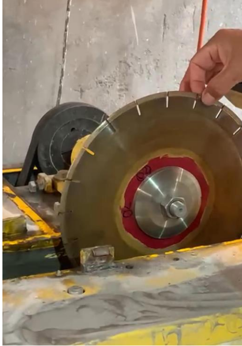
Figura 2.6 Disco de acero con borde diamantado en sala de corte de testigo