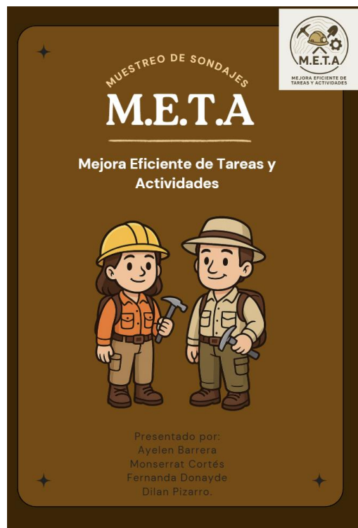
Ilustración 4. 1 Portada de libreta