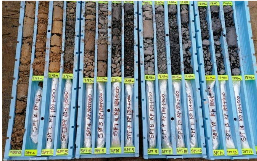
Figura 2. 3 Testigos de roca